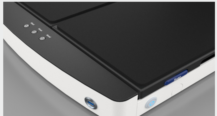
Almacene imágenes directamente en dispositivos USB 3.0

Garantía de cobertura total, hasta 5 años de repuestos y consumibles incluidos.