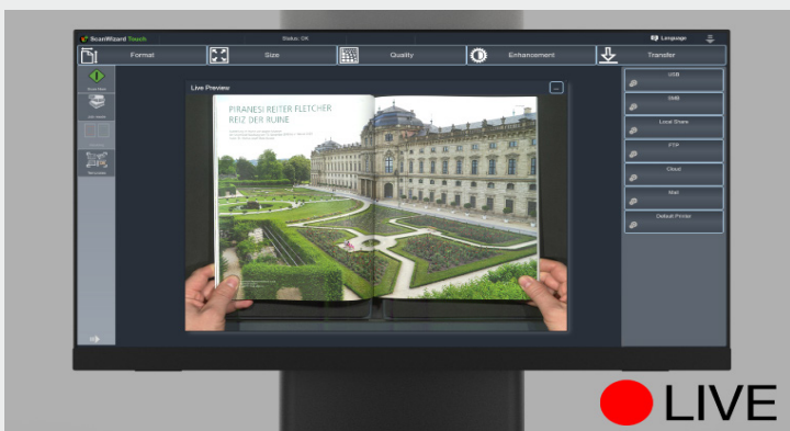
Cámara de vista previa en vivo para optimizar la posición del documento antes de escanear

Bookeye es el escáner más ecológico del mercado, que consume solo 1,5 W en modo de espera. Sus lámparas LED de alta calidad solo se iluminan cuando es necesario, ahorrando aún más energía.